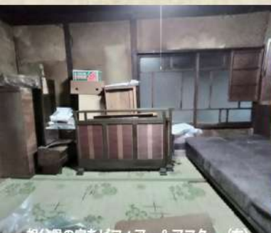
祖父の家をビフォー&アフター（右）