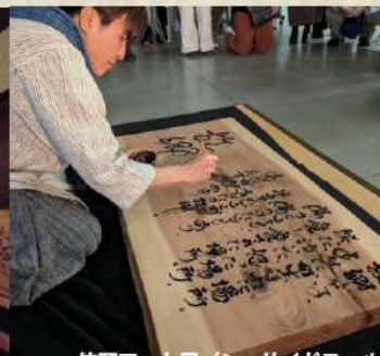
笠岡アート展（シーサイドモール）にて龍神詩「故郷」創作。開演を終えて。