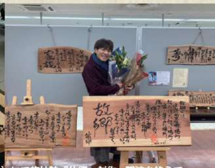
笠岡アート展（シーサイドモール）にて龍神詩「故郷」創作。開演を終えて。