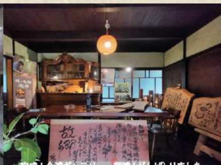
完成！金浦ギャラリー。藤崎（がんば）りました。